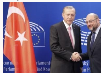
FOTO: Acord provisional alcançat entre la Comissió Europea (CE) i Turquia per a respondre a la crisi de refugiats

La Unió Europea ha proposat a Turquia que es quede amb els refugiats a canvi d'una quota de molts diners, per així poder que els refugiats siris estiguem