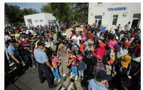
Croàcia diu que no pot rebre a més refugiats