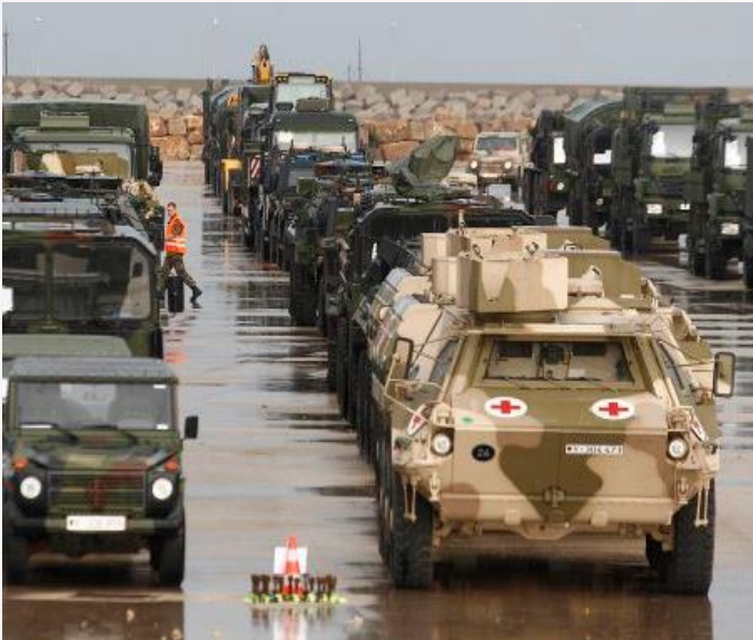
Exposició de vehicles militars a Sagunt