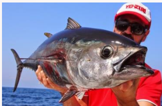
FOTO: Moment de la captura

Científics d'Azti van trobar novament a eixe exemplar a Malta a bord del barc d'esquer viu Nou horitzó obert, dins d'un projecte promogut per la Unió Europea i els governs basc i espanyol.