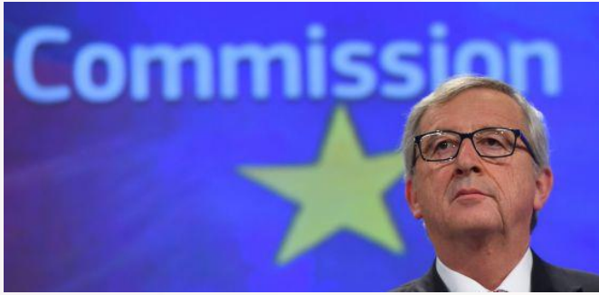
FOTO: El presidente de la Comisión Europea, Jean-Claude Juncker