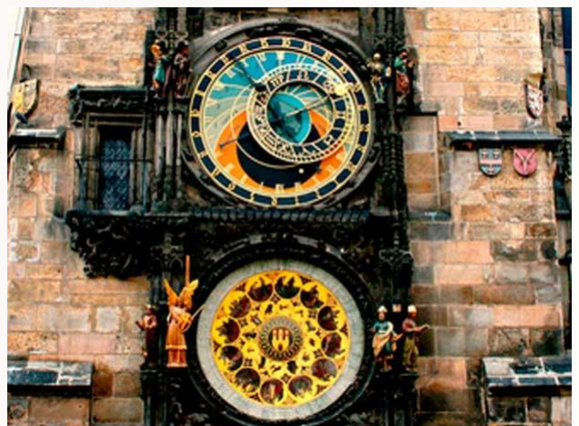
FOTO: Rellotge Astronòmic de Praga

El rellotge astroòmic de Praga complix 605 anys. Aquest antic rellotge es compona de 4 figures i va ser construït al 1410 .És un símbol historic i molt representatiu de l'edat mitjana a Europa. El rellotge de Praga va ser nombrat Patrimoni Mundial de la Unesco en 1992