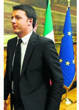
FOTO: Matteo Renzi va presentar ahir la reforma del senat

impulsada per Renzi, que també és líder del Partit Democràtic, redueix les pròrrogues del Senat. El nou Senat no tindrà dret a donar el vot o no de confiança.