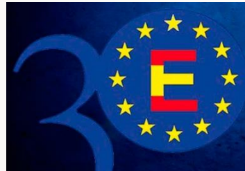
FOTO: Aniversari de l'adhesió d'Espanyac