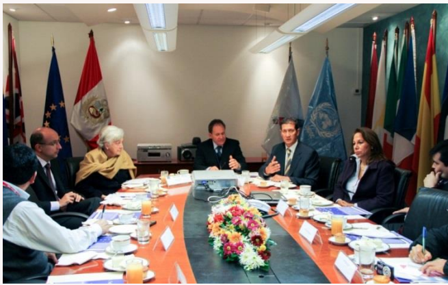
FOTO: La Unió Europea i els països que han firmat el pacte

Destacant el marcat caràcter internacional d'aquest tipus de tràfic de drogues, en el qual intervenen organitzacions delictives que operen en diferents països amb vaixells de matrícula diversa i tripulacions de diferents nacionalitats.. Preocupats per la dificultat per obtenir informació ràpida que permeti intervencions en aquest àmbit, tant a escala europea com internacional,