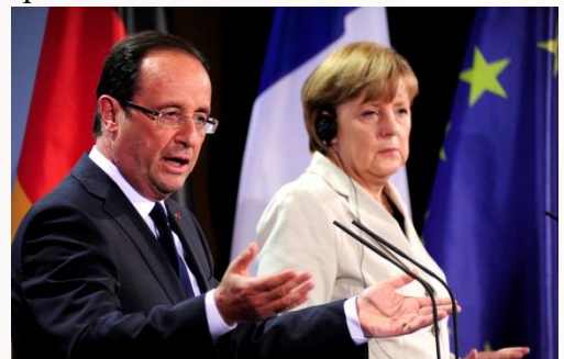
FOTO: Merkel i Hollande en la seua comparecència

Angela Merkel i François Hollande han intervingut en el Parlament Europeu de Estarburg de forma conjunta i han coincidit en defendre la importància d'avançar en la Integració Europea per tal de poder afrontar els reptes del als quals s'enfronta la Unió Europea