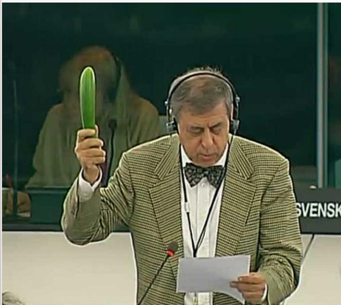
FOTO: La Comisión Europea pide que no se lancen alertas alimentarias sin pruebas

Aquestes bateries alimentaries causen mal a moltes persones per tot el món i més per els països pobres con Àfrica Amèrica del sud etc