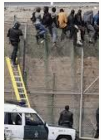
FOTO:Inmigrants a la cerca de Melilla

L·ultime onada d·inmigració demostra que europa s·enfrenta a un desafiament sin precedents.Aproximadament 57300 inmigrants irregulars arribaron desde 2014 hasta 2015 arribaron el triple que en 2014