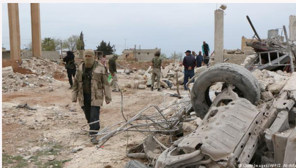
FOTO: Bombardeigs russos a Síria

Els misils russos van dirigits a Síria i caueb a Irán, l'aviació russa ataca a 27 objectius de E.I. a Síria.