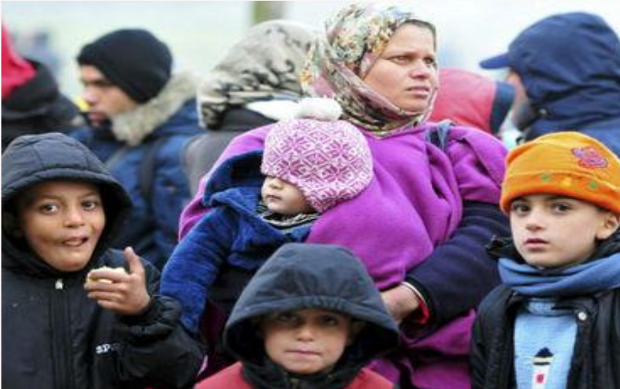
FOTO: Xiquets refugiats

ACNUR (Agència de Nacions Unides per als Refugiats) rep denúncies d'abusos sexuals als refugiats durant la travessia als països del nord d'Europa per traficants de persones.