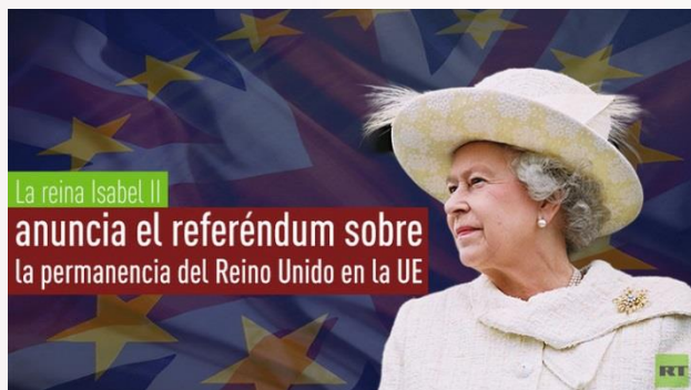
FOTO: La reina Isabel II anuncia el referéndum sobre la permanencia del Reino Unido en la UE

PER A ANARSE: Aquesta campanya es va presentar el 9 d'octubre inclouix diputats,lores conservadors,laboristes i del UKIP.Està financiada per persones de diferents afiliacions.