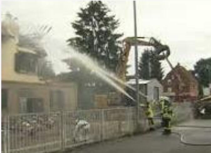
FOTO: Queman un centro de refugiados en Weissach (Rems-Murr-Kreis)Alemania

La confederació de municipis i el sindicat de la policia alemanya exigiren hui una millor protecció per als refugiats, reforçats per les forces de seguretat i un increment substancial de personal per tal fer front al flux de sollicituts d'asil.