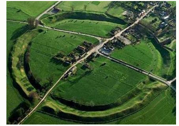
FOTO: Excavacions subvenció de 24 ,5 milions de corones faran posible que els investigadors coneguen com es van organitzar els vikings; la seua edat i el paisatge en què s'ubicaven.

Ara ha arribat el moment en que els arqueòlegs descobreixen els secrets ocults i el llegat de la fortalesa. Uns mesos despres del seu troballa , una