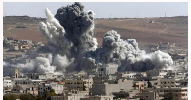
FOTO: Bombardeigs russos a Siria

FOTO: Bashar al Assad guanyà les presidencials en Siria amb el 88,7% dels vots