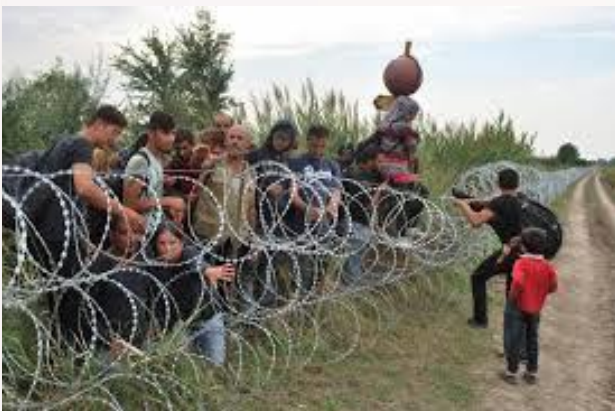
FOTO: Refugiats siris intenten botar cerca de la frontera entre Hungría i Serbia en Rösztke

Reforçarà a l'exèrcit amb armament no letal com bales de goma, granades de gas etc. El primer ministre Victor Orban diu que les cerques son la solució als refugiats.