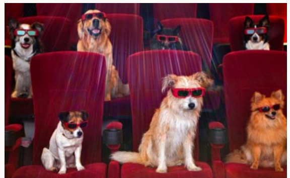
FOTO: Projeccions per a gossos