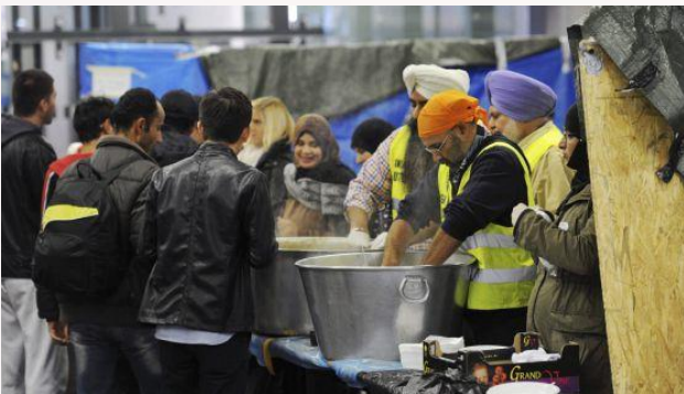
FOTO: Voluntaris alimenten a refugiats siris en la estació de tren de Viena

En la capital moltes persones ho estan passant mal, treballen dur i no veuen els resultats