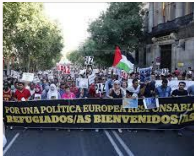
FOTO: Manifestantes en apoyo a los refugiados

Entre els mesos de gener i setembre 350 mil persones accediren a la Unió Europea a través d'aquestes illes, quasi 49 mil a soles en setembre, en la seua majoria ciutadans de nacionalitat síria d'immigrants la majoria dels 700 mil immigrants són musulmans.