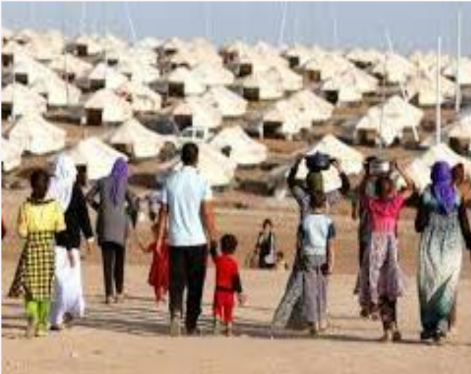
FOTO: Campament de refugiats a Mytilini