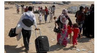
FOTO: crisi humanitària amb l'arribada de milers de refugiats..

Els refugiats es veuen forçats a fugir perque no dispoen de la suficient protecció per part del govern del seu propi país