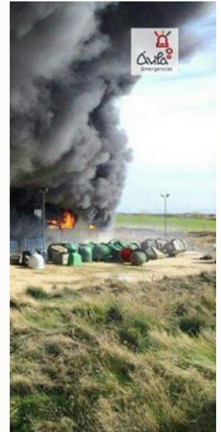
FOTO: Incendi actiu

Els residus que queden tras l'incendi en la subestació de la Ande en San Lorenzo no suposen que haja perill, per a la salut però el fum és tòxic i fou dispersat per e les condicions climàtiques.