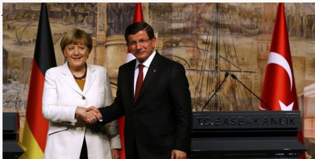
FOTO: Apropament de les negociacions entre Merkel i Turquia

Convertir-se en el guardià de la porta del darrere de la Unió Europea pot tenir premi per a Turquia . Les autoritats turques van aconseguir arrencar aquest diumenge diverses promeses en ferm a la cancellera alemanya ,