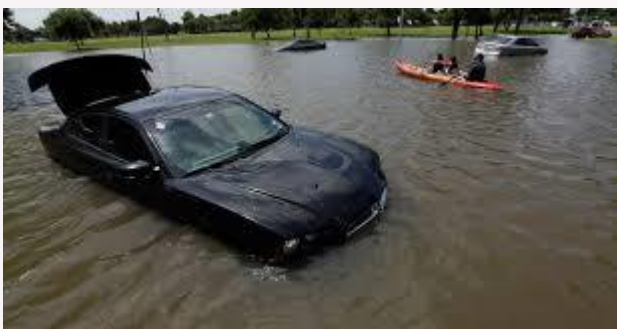
← FOTO: Vehícle de les víctimes

En Roma el dia 17 d'octubre la policia ha trobat els cosos d'una dona de 75 anys i d'un home de 60 anys per que han hagut moltes pluges i l'aigua ha alcançat una alçada de 1,50 metres.